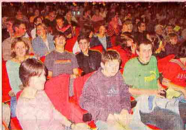
Le théâtre était comble et comptait beaucoup de jeunes parmi les spectateurs.

Les comédiens ont fait beaucoup rire le public qui a salué leur interprétation par un tonnerre d'applaudissements. Il faut dire que le spectacle avait tous les ingrédients du succès : magnifiques costumes d'époque, personnages de la pièce bien campés et intermèdes musicaux dansés par les acteurs, le tout dégageant un évident plaisir de jouer. Créée pour distraire Louis XIV, la pièce adaptée par la compagnie Candela n'a pas pris une ride et a rempli le théâtre un soir de match de football important pour la France. Le mot de la fin fut pour Philippe De-